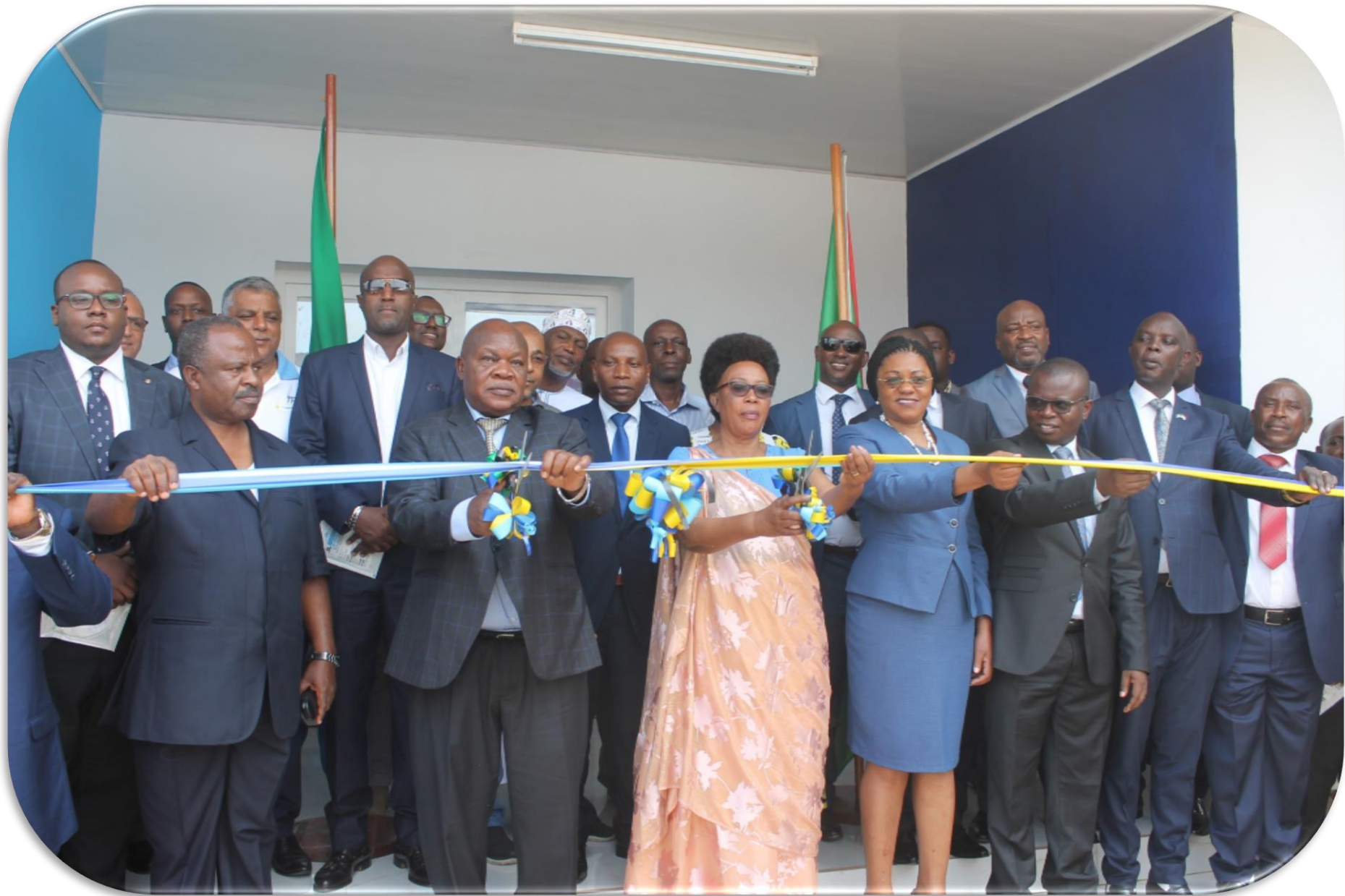
Coupure du ruban lors du lancement du Bureau de Liaison du Port de Dar Salam à Bujumbura