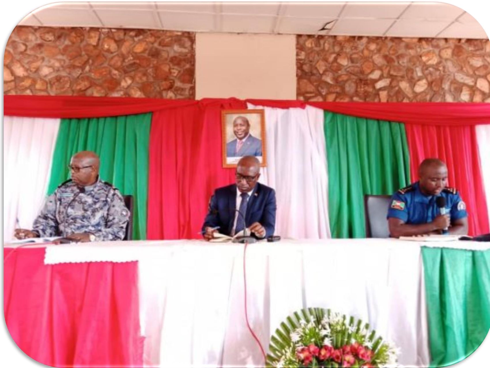
Réunion avec les policiers du Commissariat Régional Centre