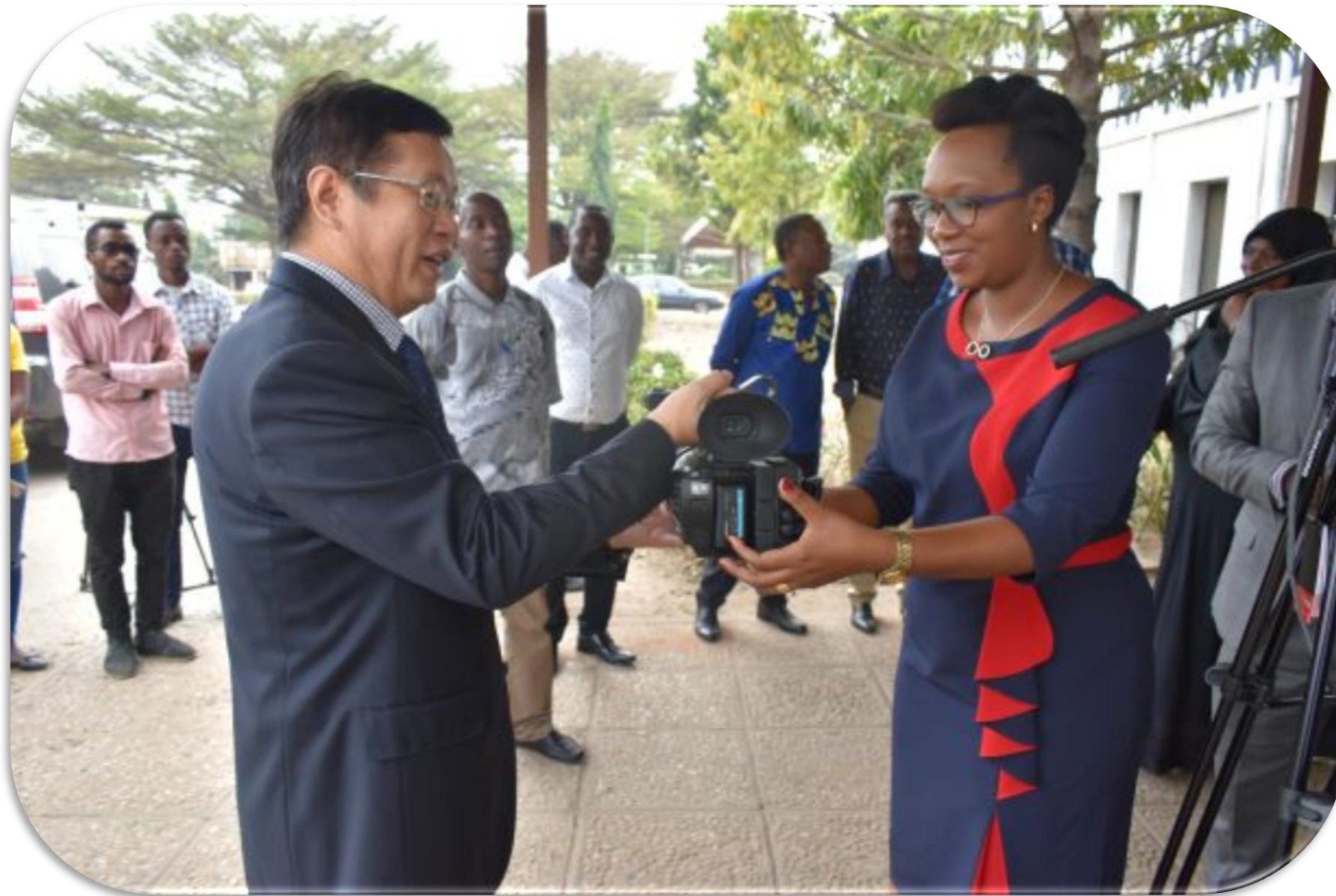
Don du matériel audiovisuel à la RTNB