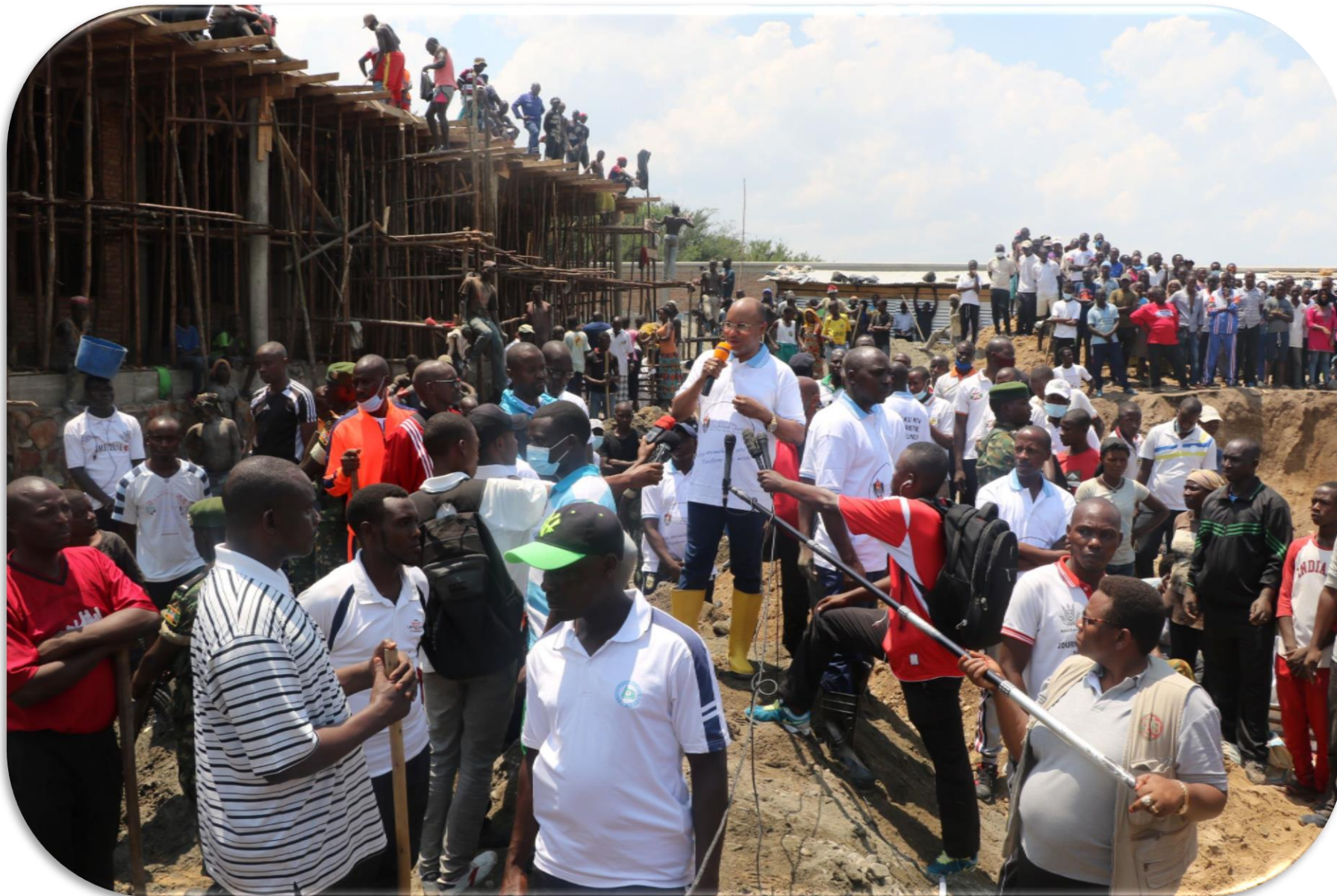
CPG, Alain Guillaume BUNYONI, Premier Ministre. Travaux communautaire du 03/10/2021