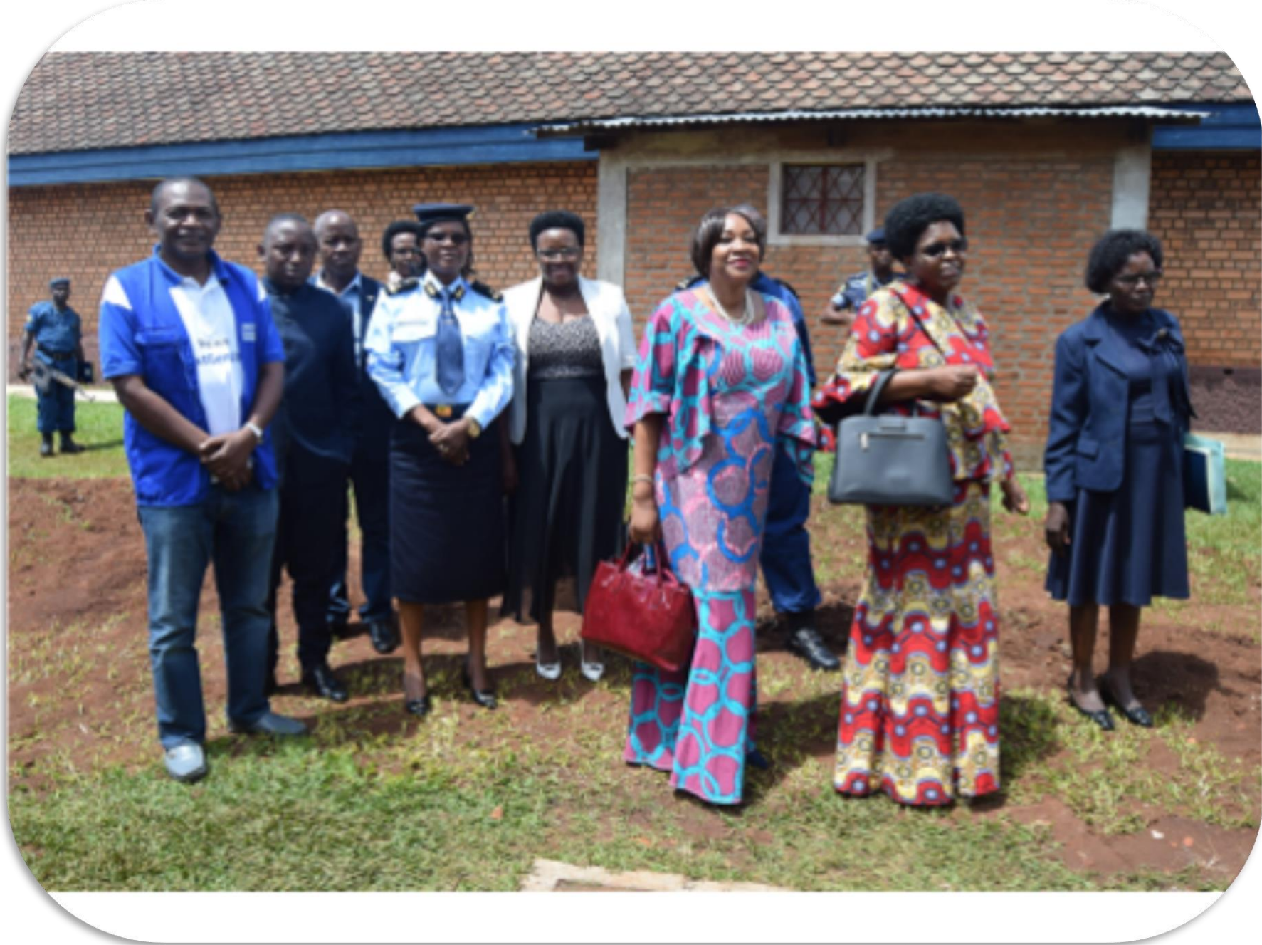
Descente du Ministre dans les GU avec la Représentante du PNUD