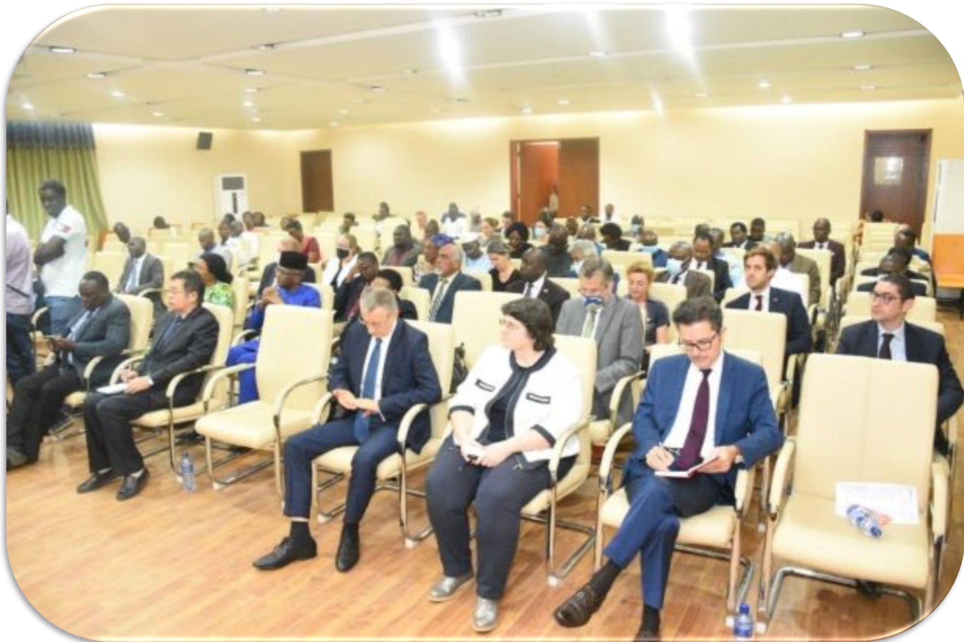
Rencontre du Ministre avec les Représentants du Corps Diplomatique et Consulaire et des Organisations internationales le 9/10/2020