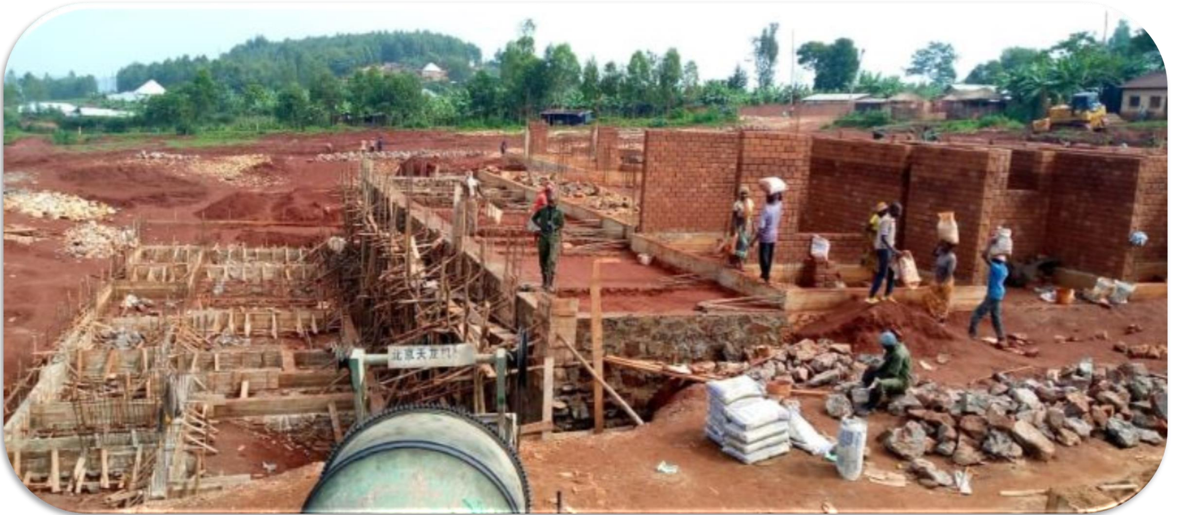
Chantier de l'usine à briquettes