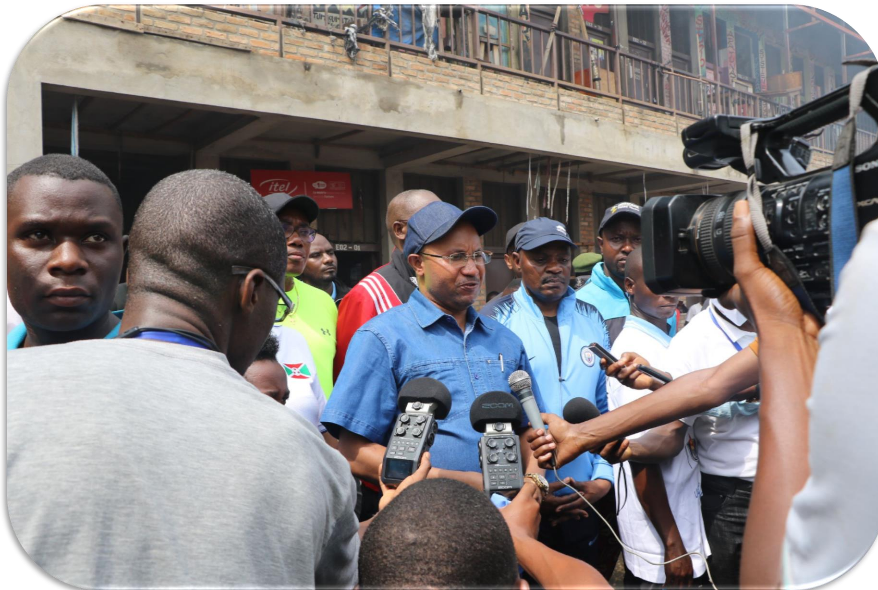
Alain Guillaume BUNYONI, Premier Ministre. Visite de travail à Kamenge après une incendie du marché, le 03/10/2021.