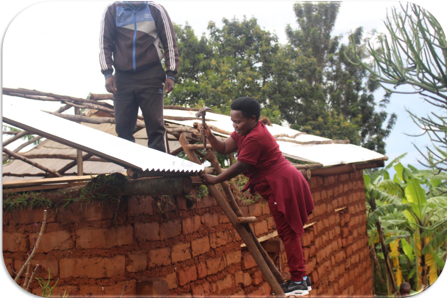
Assistance en tôle à Mwaro le 28 nov 2020