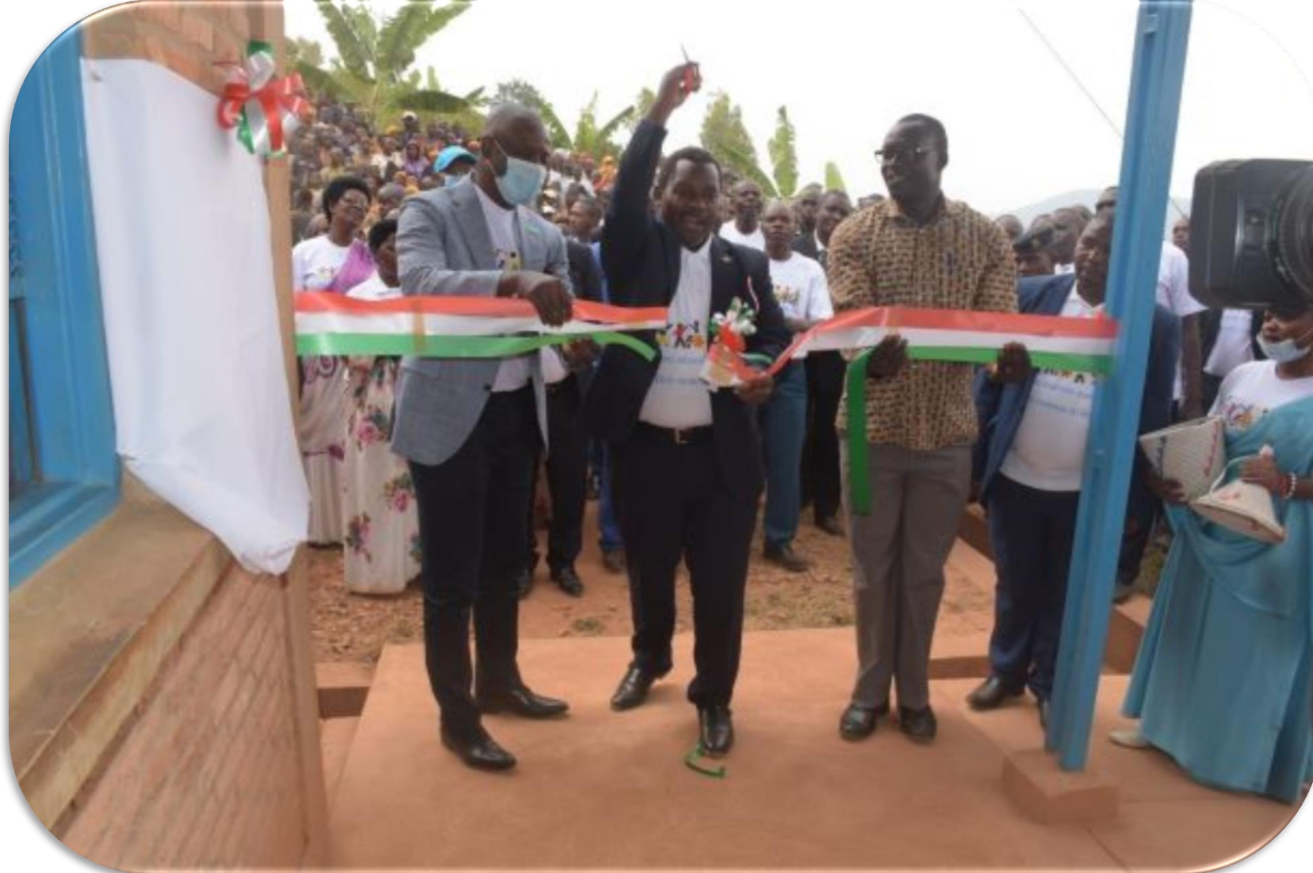
Inauguration d'une école fondamentale de KAREMBA Gitega le 7/9/2020