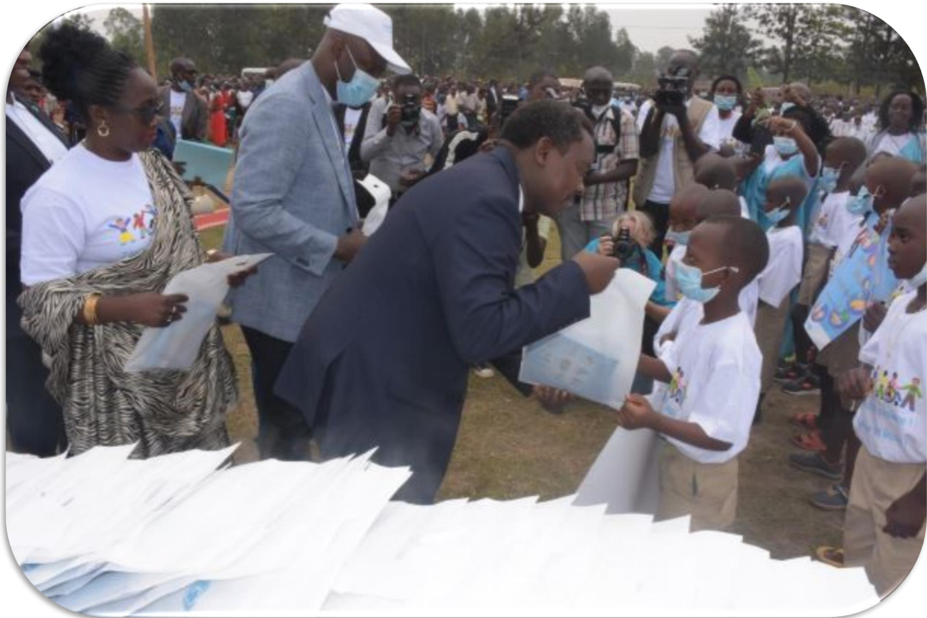
Distribution du Kit scolaire dans le programme Back to SCHOOL à Rusengo en date du 7/9/2020