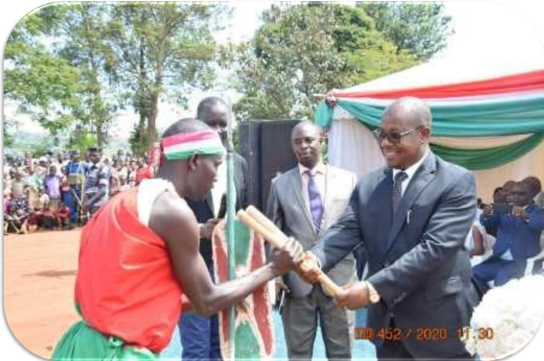
Organisation du Festival National de la Culture du 08 au 09/10/2020 à Gitega