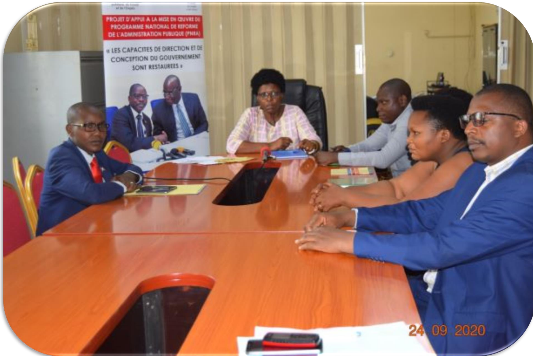
Réunion avec les Responsables de la Brigade Spéciale Anti corruption le 24/09/2020