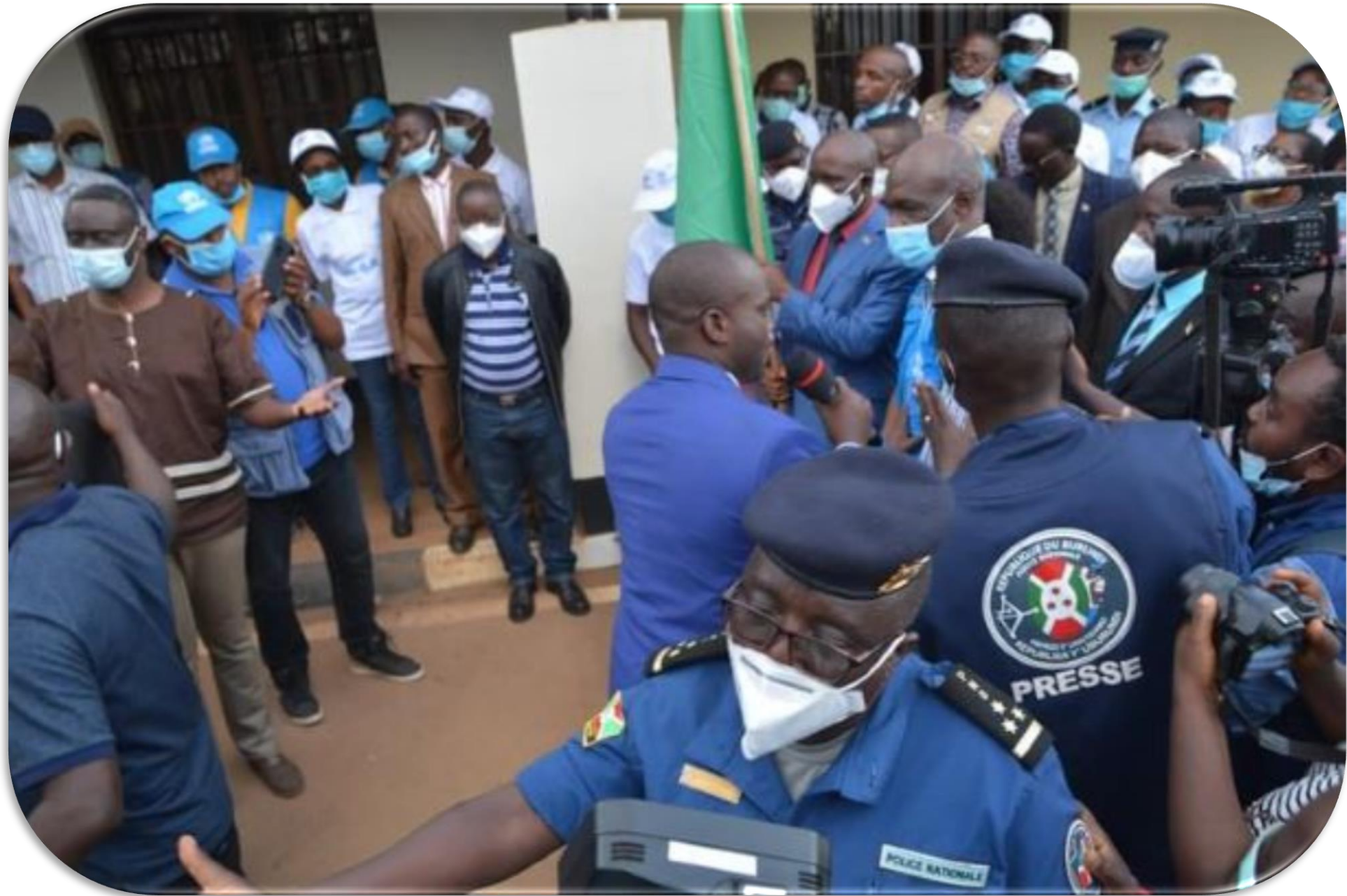
Accueil des rapatriés venus du Rwanda