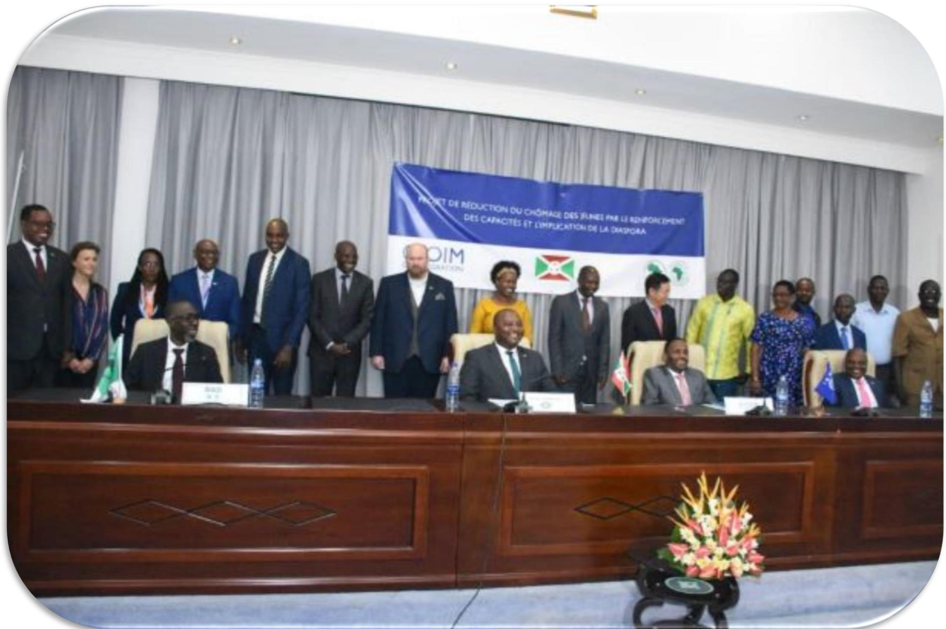
Lancement officiel du projet de réduction du chômage des jeunes par le renforcement des capacités et l'implication de la Diaspora, le 3/9/2020.