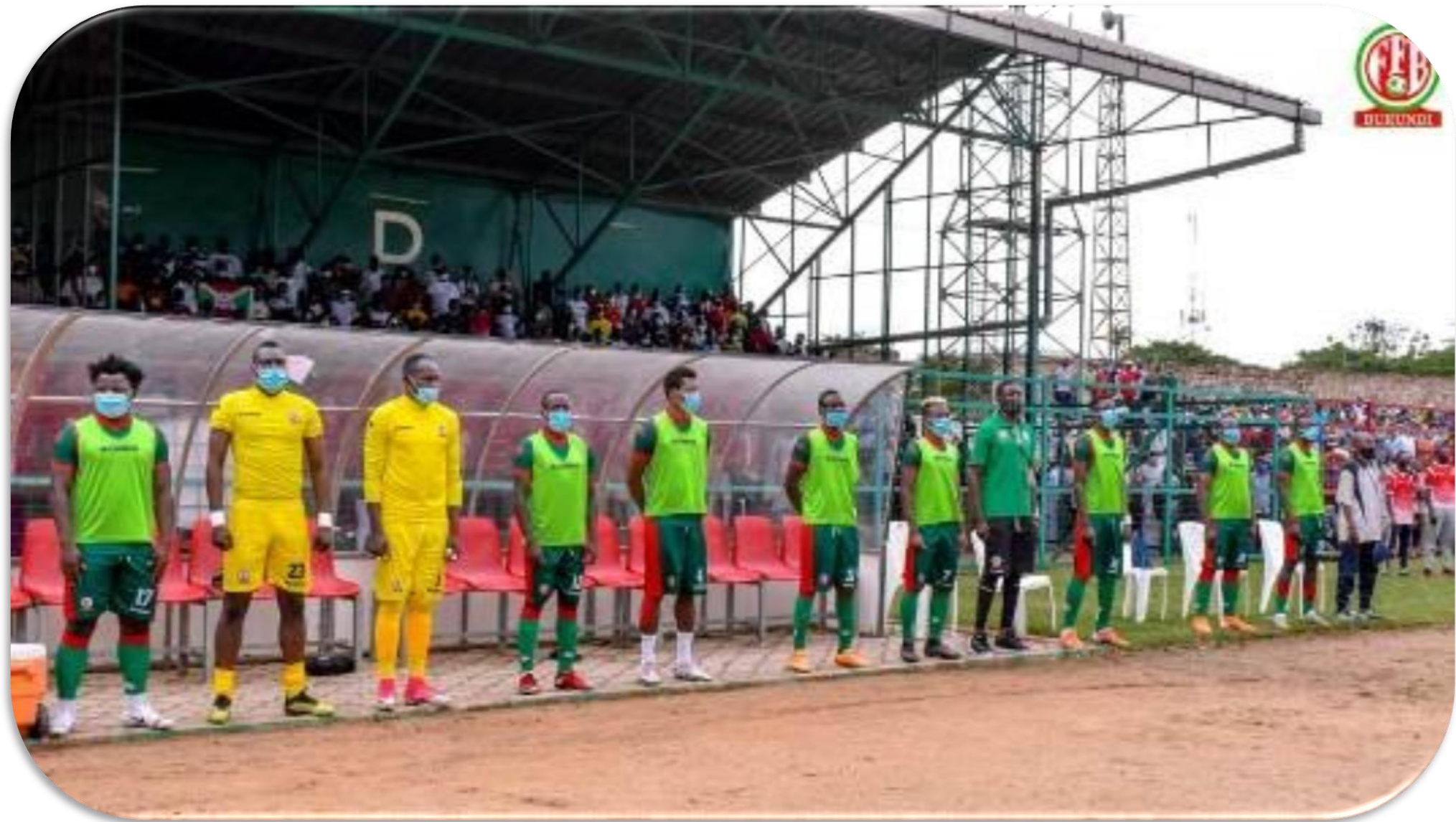
Organisation du championnat intercommunal de football masculin, édition 2020-2021