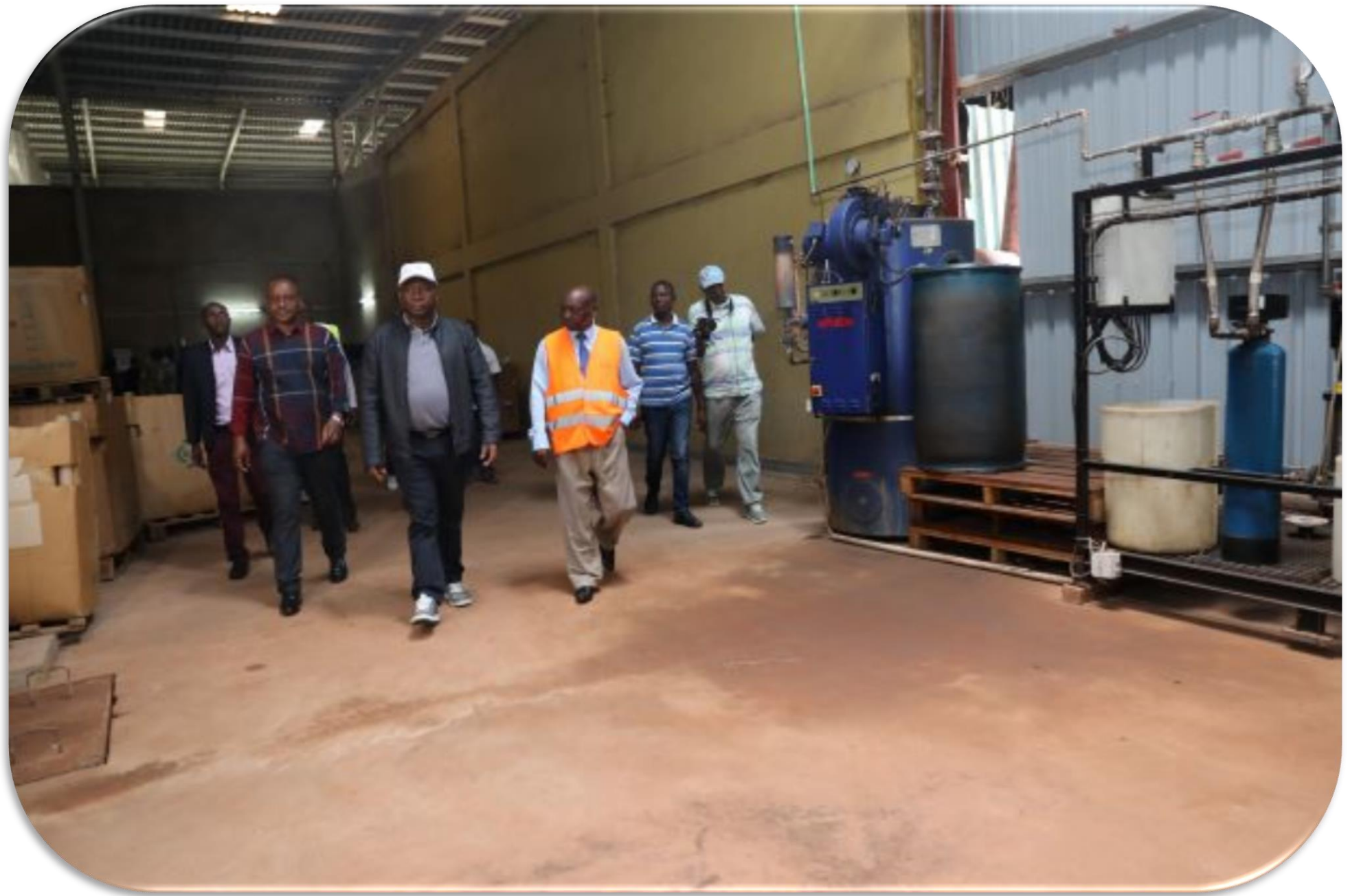
Visite des entreprises le 02/12/2020