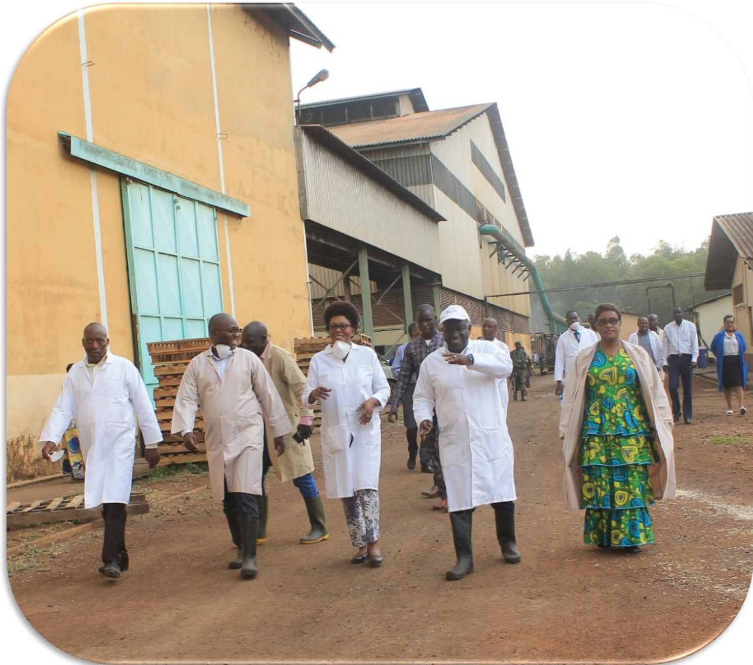
visite de la sosumo