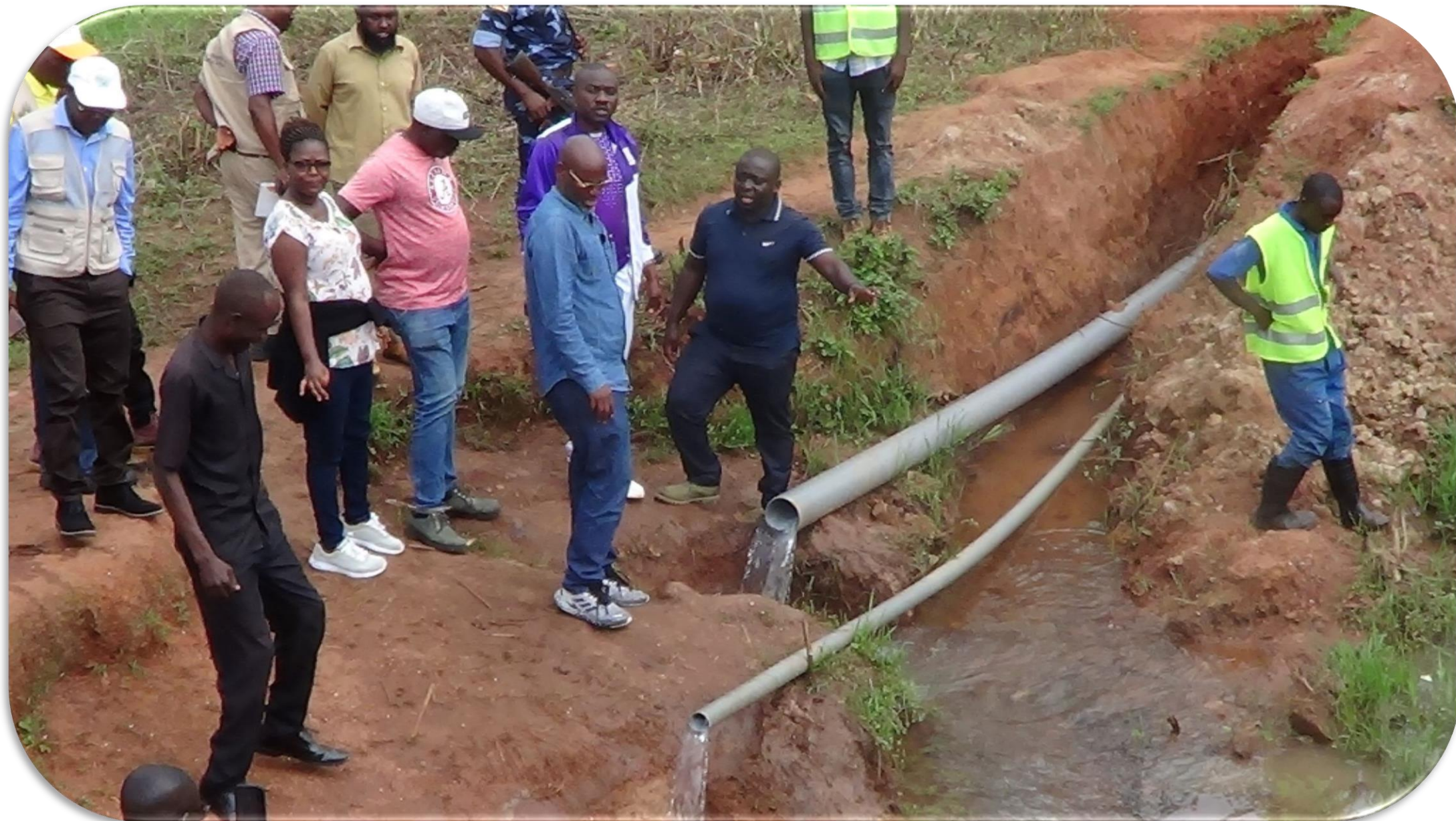
Construction en cours de l'AEP Bugabira