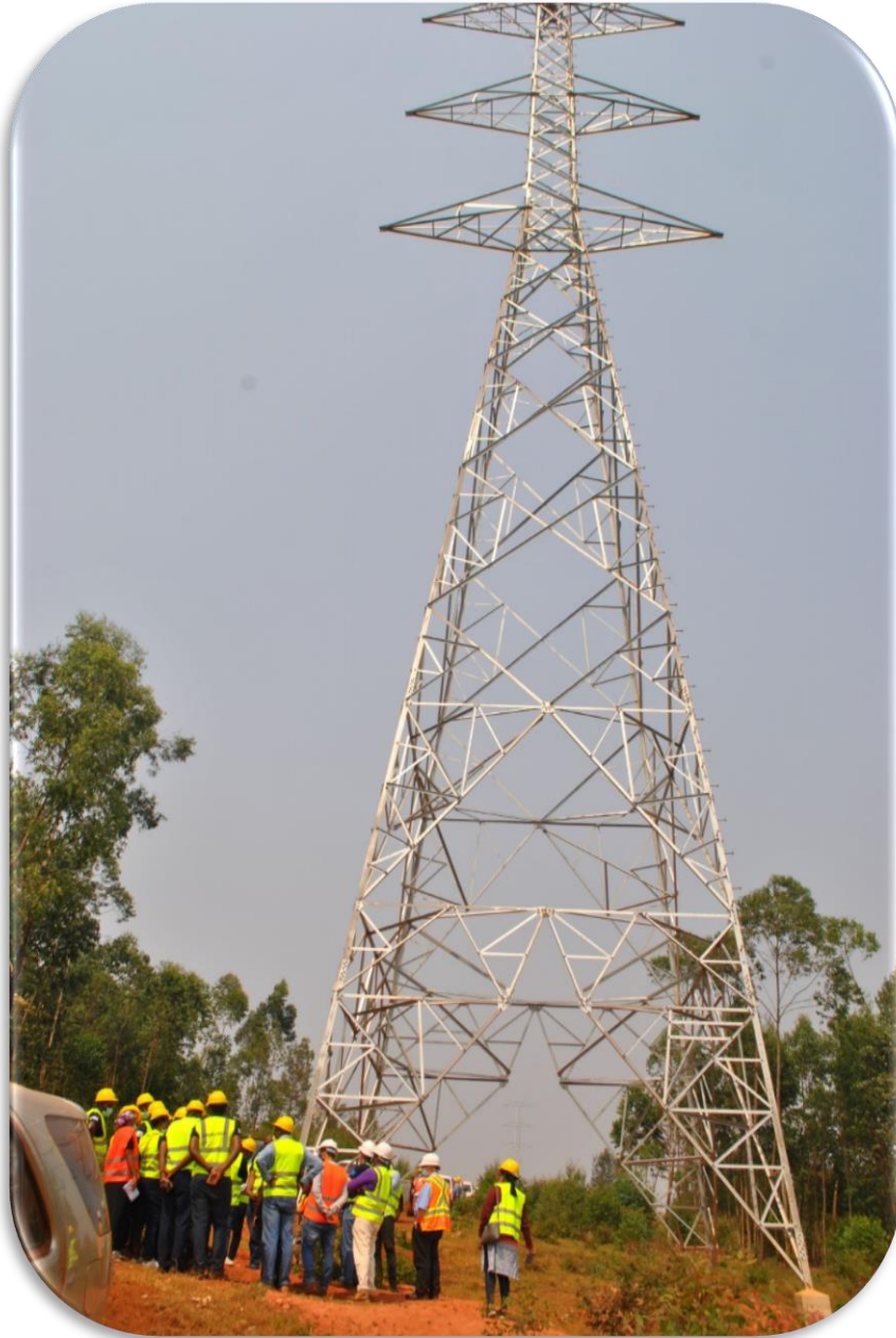
• Ligne de transport HT Rusumo Falls