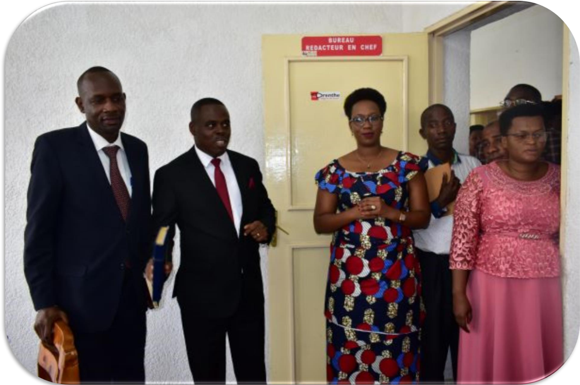
Visite de la Radio ISANGANIRO