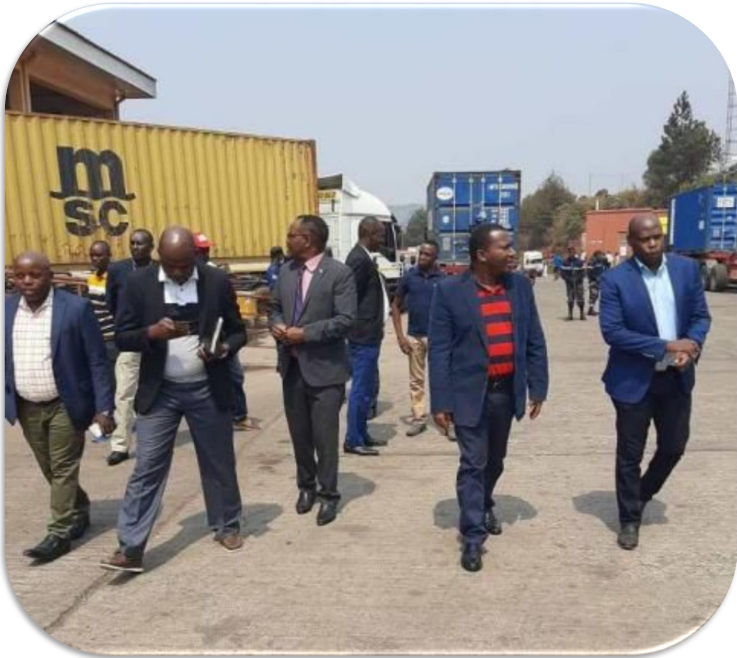
Visite de terrain à l'OBR, 13-14/08/2020.